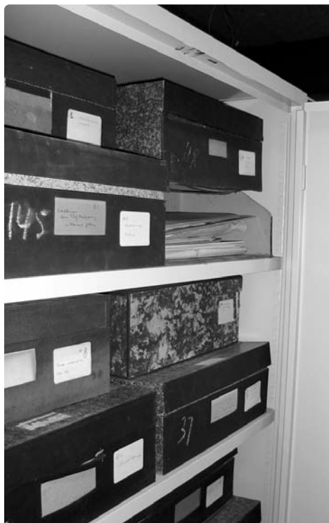
De karakteristieke kartonnen dozen waarin het archief was opgeslagen.

Dit is typerend voor de situatie waarin veel wetenschappelijk erfgoed zich bevindt. Er zijn genoeg mensen die het belang ervan inzien, maar zolang niemand zich er direct verantwoordelijk voor voelt, regeert het toeval. Het Sterrewachtarchief is slechts één van de vele wetenschappelijke archieven die verspreid over de Nederlandse universiteiten liggen. Ook op de kamers van nietsvermoedende wetenschappers