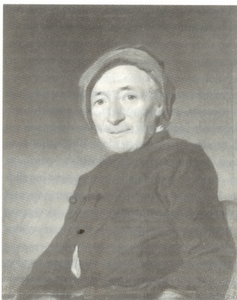
Portret van Elie Luzac. Pastel, ca. 1770 (collectie Stedelijk Museum De Lakenhal, Leiden)

Een staatsvorm zonder Oranjes: dat is geen nieuw idee. Reeds in 1672, in het jaar dat de gebroeders De Witt werden vermoord als gevolg van een conflict met een Oranje, werd over het stadhouderschap een nationaal debat gevoerd. Die discussie zou ook in de achttiende eeuw gevoerd worden, vooral ten tijde van Willem V, die door zijn opposenten als een onbenul werd beschouwd. Hij stelde zich in diverse politieke kwesties volkomen initiatiefloos op en volgde de adviezen van zijn voogd, de hertog van Brunswijk, klakkeloos op. De stadhouder kon op den duur in de ogen van zijn critici geen goed meer doen, waarna er – onder druk van de burgerij – eerst een einde kwam aan de invloed van zijn voogd en daarna aan zijn eigen macht. Zijn positie was ver-