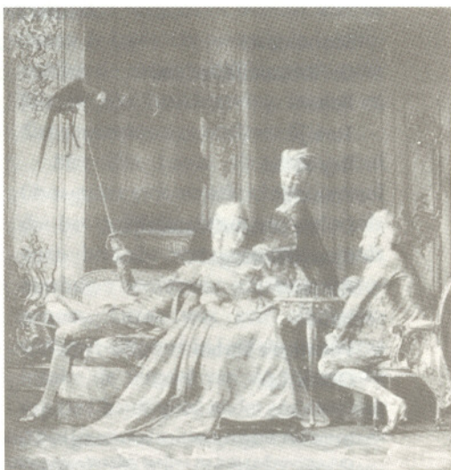
Struensee speelt schaak met koningin Mathilde. Op de bank, met papagaai, ligt koning Christiaan. Bomann Museum Celle.