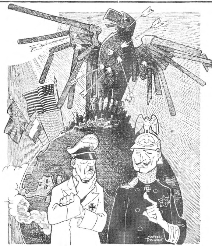
Soms denk ik wel eens, dat het tóch niet zo'n goed idee was, korporaal

Metro verschijnt voortop om de veertien dagen. — Uitgeverij: „Metro”. — Druk: B.A.V.I.D. (De Algemeene Vrije Lande-Druckers). — Voorlopige abonnementsprijs: f 1.40 per kwartaal. — Voortop-g adres van ditzette, redactie en administratie: Keizersgracht 42e, Amsterdam. Telefoon 20130. — Directeur: Dick van Veen (vooreheen o.a. Bonnes - Huttenberg - Veenstra - Dekker) — Wauwaemad Hoofredactie: De Metrolieten-Club