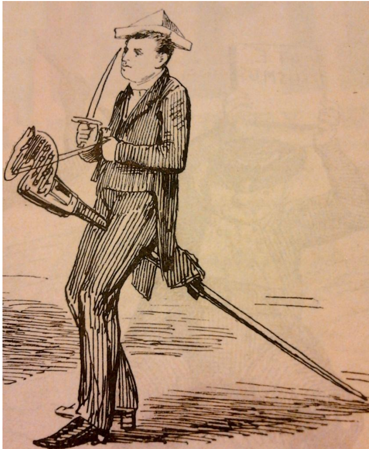
Afb. 2: Kuyper als politiek veldheer met een schoolstokpaard’, een verwijzing naar de schoolkwestie. Uilenspiegel 8, 1876, 16.

Uilenspiegel bekritiseerde naast de sterke persoonlijke invloed van Kuyper vooral de religieuze grondslag van zijn politiek. Kuyper was zich bewust van deze tegenstand. Uilenspiegel maakte melding van de zorgen die Kuyper uitte in het vernieuwde orthodoxe blad De Heraut (1877-1887). Daarin meldde hij dat ‘de gezamenlijke kerken, “die zich naar den Christus noemen” werden aangevallen door ‘een duivelsche lust om te spotten met het heilige’. Dit maakte volgens hem dat ‘de mannen van het penseel of de lier en achter hen aan, in naam der kunst de prententeekenaars en humoristen, aan het christendom een oorlog hebben aangedaan’. 17 Deze aanval deerde Uilenspiegel niet: ‘gij zijt veel te vermakelijk, om u te kunnen haten; [...] heel uw afwijken van het normale en het gezonde, heeft in onze dagen een karakter gekregen [...] waarmee men lacht, om het ernstige gezicht dat gij er bij zet.’ 18