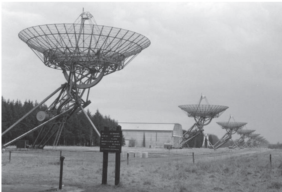
Fig. 2: Oort's laatste schepping: de Westerbork Radio Synthese telescoop.

Daarmee kom ik nu tevens op de vraag die je me stelde: Moet voor het gehele [...] Project steun aan de N.S.F. gevraagd worden. M.i. alleen als dat een werkelijk groot bedrag zou kunnen opleveren [...]. Wij hebben ons door de Belgen eenmaal laten dwingen steun elders, nl. bij OEEC, te vragen. Dat heeft niet meer dan chicken-feed opgeleverd en verder een heleboel rompslomp en oponthoud. Zoiets moet ons niet nog eens overkomen. 46