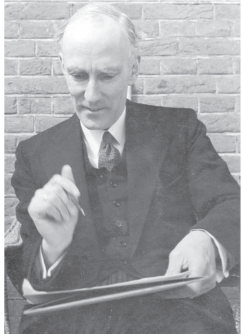
Fig. 1: Jan Hendrik Oort (1900–1992).

The general scientific crisis in America and Western Europe is reflected in astronomy also. As a result, cosmogony, the branch of astronomy concerned with questions of the development of celestial bodies, has been turned into a repository for all kinds of idealistic nonsense and absurd fabrications which [...] aim at restoring the legend of the world's creation. 9